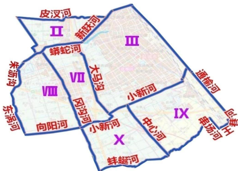
图 1：城市防洪区位置图