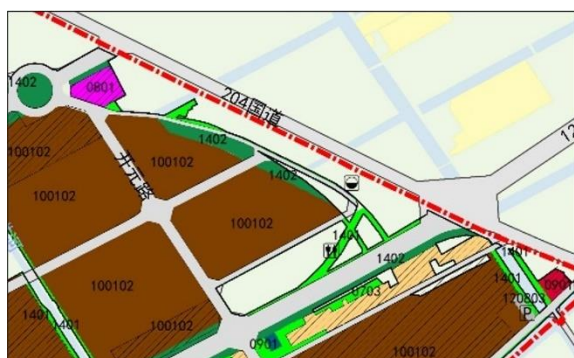
调整前土地利用规划图