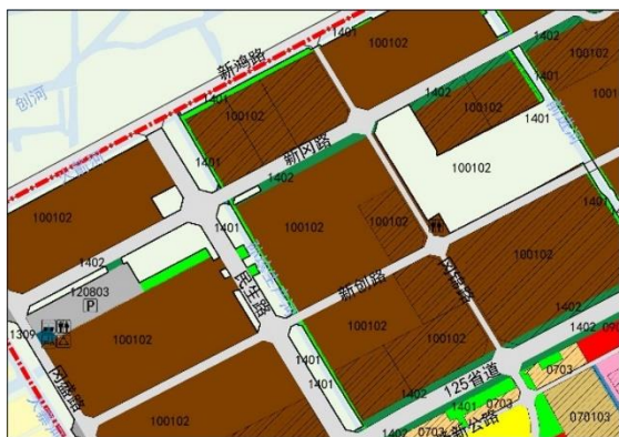
调整前土地利用规划图