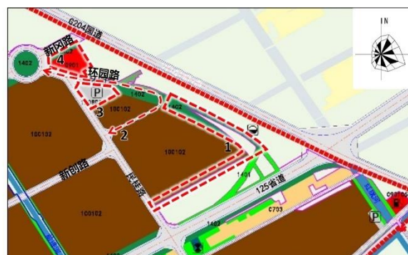
调整后土地利用规划图

S125 以北、民桂路以东区域详细规划调整方案对比图（局部）（左图为调整前、右图为调整后）