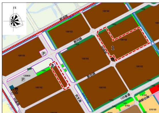
调整后土地利用规划图