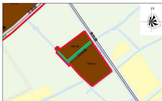
调整后土地利用规划图

吴拾路（止刘路）西侧区域详细规划调整方案对比图（局部）（左图为调整前、右图为调整后）