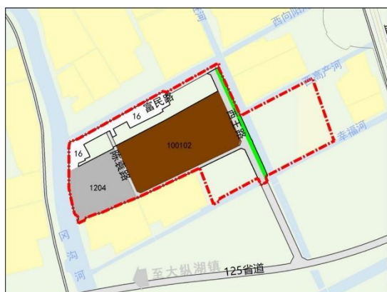
调整前土地利用规划图