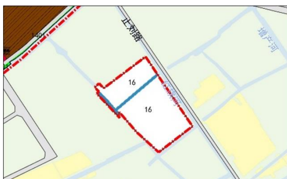
调整前土地利用规划图

(2) 完善吴拾路（止刘路）西侧道路交通系统与蓝绿空间体系，规划新增同桂路为弹性控制道路，具体走向、线型可结合实际项目建设需求进行调整与实施。