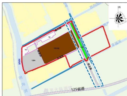
调整后土地利用规划图

03 街区（冈沟河东侧）区域详细规划调整方案对比图（局部）（左图为调整前、右图为调整后）