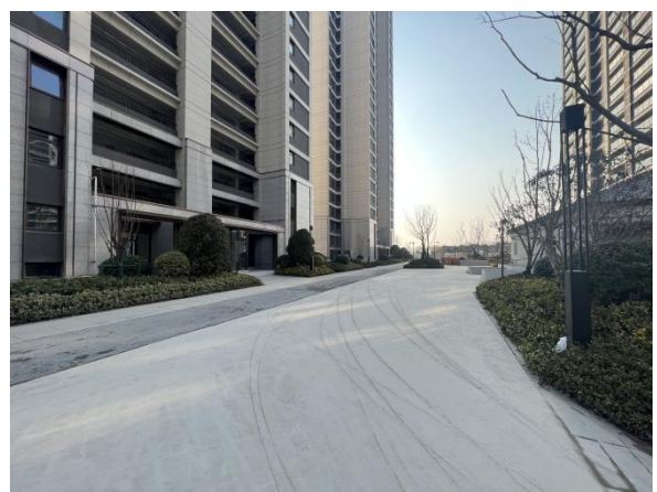
重要水土保持工程现场核查照片